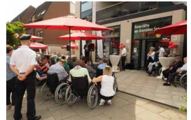
Vor der neu eingeweihten Heimstätte feierte das Sozialwerk mit seinen Gästen ein fröhliches Fest.