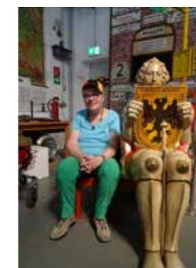
Foto links: Teilnehmer des Ausflugs erkunden alte Straßenbahnen.