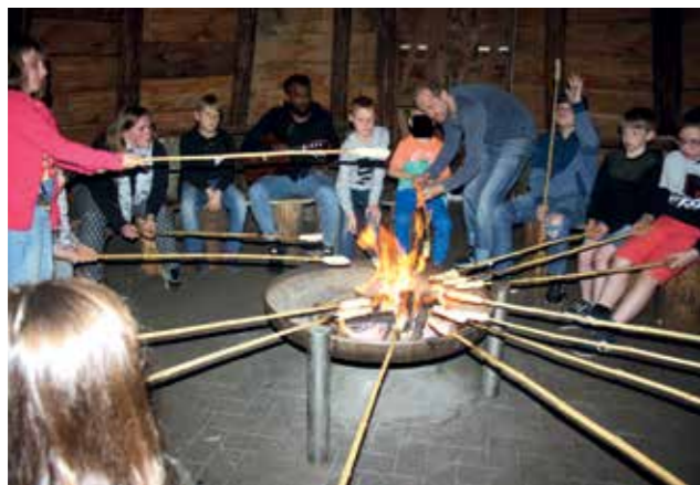
Stockbrot machen am Lagerfeuer gehörte zu den Wünschen der Kinder für die Freizeit.

Im Vorfeld gab es zwei Termine, an denen sich die Kinder und die Mitarbeitenden kennenlernen konnten, denn die beiden Wochengruppen liegen in zwei verschiedenen Stadtteilen, und sowohl Kinder als auch Mitarbeitende haben durch den Alltag weniger miteinander zu tun. Doch in diesem Jahr wollten sie zusammen Urlaub machen. Gemeinsam ist beiden Einrichtungen, dass sie Wochengruppen sind. Das bedeutet, dass Kinder und