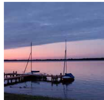
Urlaub an der Ostsee

viel geschwommen und Kanu gefahren – wie es sich für einen Urlaub an der See gehört. Mit der Ostsee direkt vor der Tür kam keine Langeweile auf. Am letzten Abend wurde die für alle Beteiligten gelungene Ferienreise mit einem gemeinsamen Grillen beendet.